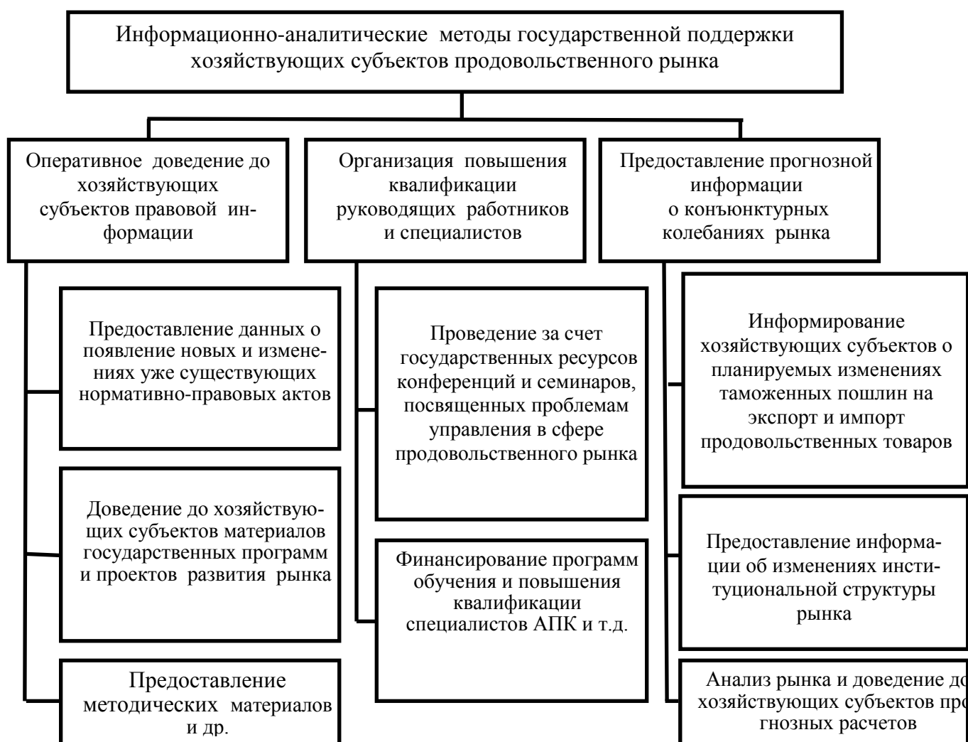
Рис. 3. Информационно-аналитические методы государственной поддержки хозяйствующих субъектов продовольственного рынка

Однако пока еще нельзя сказать о высокой эффективности информационного сопровождения рынков продовольственных товаров в нашей стране. На наш взгляд, существующая структура требует расширения путем введения в ее состав межрегионального уровня.