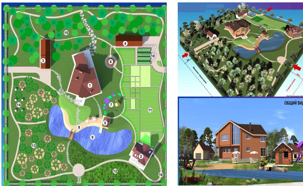
Рис. 2. Эскизные проекты и модельные макеты обустройства родового поместья

В Белгородской области осуществлены проекты в х. Гремячий сельского поселения Маслово Пристань Шебекинского района и в с. Устинка Белгородского района – именно они и были инициаторами разработки закона Белгородской области «О родовых усадьбах», который стал прототипом для проекта федерального закона [7]. Так же осуществлен проект родового поселения «Заречье», которое является первым официально созданным по закону Белгородской области.