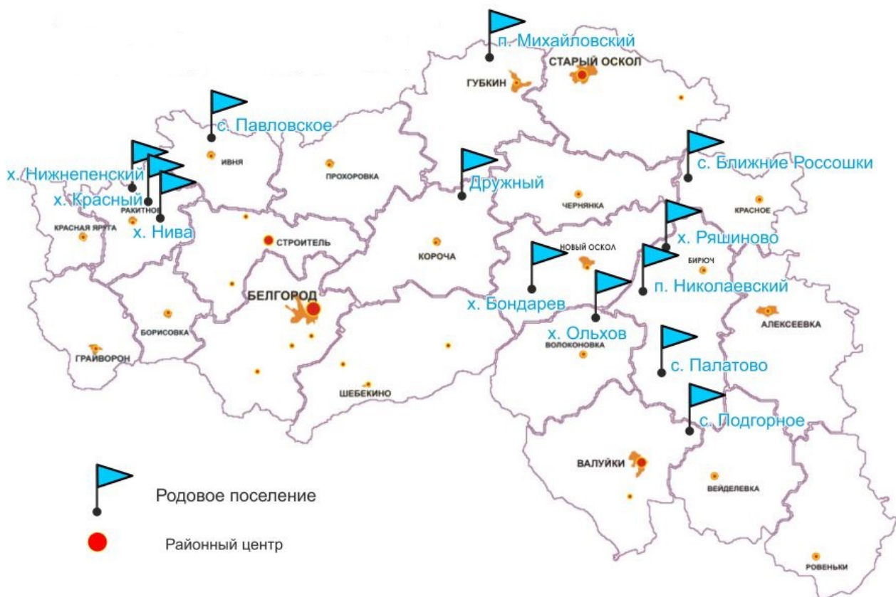
Рис. 1. Места расположения родовых поселений в Белгородской области

Таким образом, для реализации Проекта в наличии имеется 5 тыс. га земли для родовых поместий в 11 районах Белгородской области. Работа в этом направлении продолжается. На рисунке 1 представлены предлагаемые АО «Белгородская ипотечная корпорация» земельные участки в муниципальных образованиях [5].