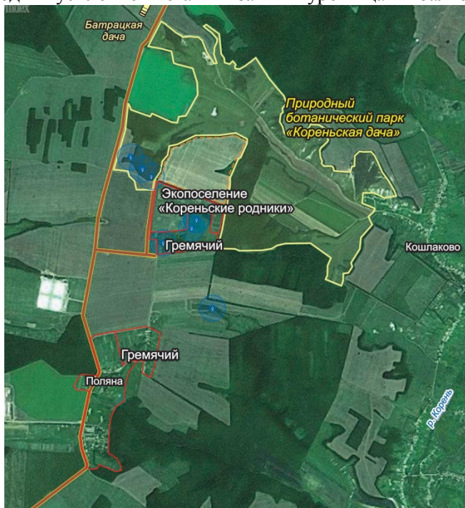
Рис. 5. Предлагаемая территория природного ботанического парка «Кореньская дача»

С целью сохранения природы Перспективой развития предложено создание особо охраняемой природной территории регионального значения – Природного ботанического парка (рис. 5), выведение части земель из сельхозоборота и ограничение хозяйственной деятельности в указанных урочищах и балке Каменный лог.