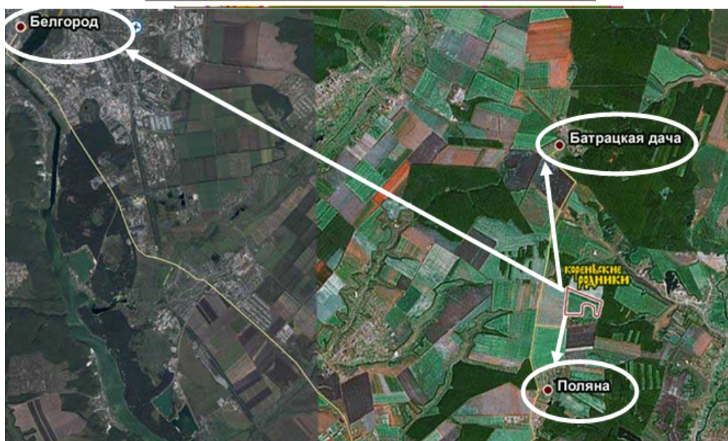
Рис. 3. План развития родового экоселения «Кореньские родники» и его месторасположение