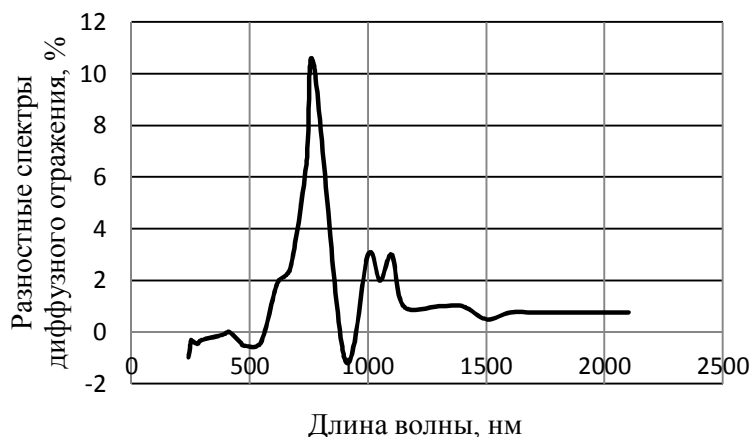
Рис. 2. Кривая зависимости разностных спектров диффузного отражения полиалканимида облучения электронами от длины волны

ен по точкам, получаемым вычитанием коэффициентов отражения до облучения ( r_{\lambda 0} ) из коэффициентов отражения после облучения ( r_{\lambda \text{обл}} ): \Delta r_{\lambda} = r_{\lambda 0} - r_{\lambda \text{обл}} .