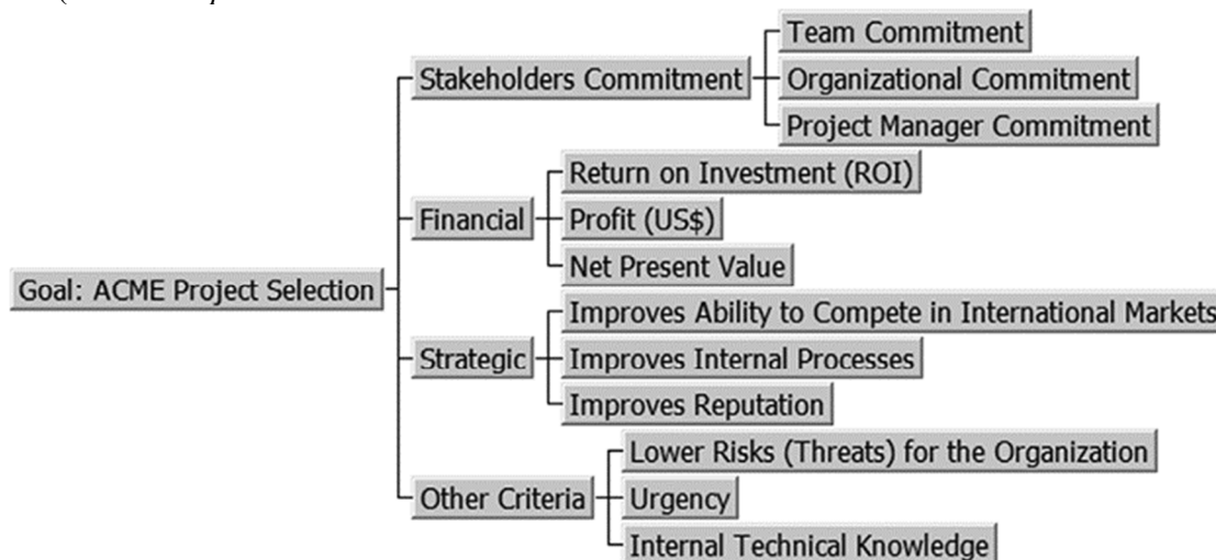
Рис. 1. Пример иерархической структуры критериев МАИ для сравнения инвестиционных альтернатив [4]

alternatives ), предложенной автором метода и в наиболее распространенном виде оперирующей девятью степенями сравнительной важности (рис. 2).