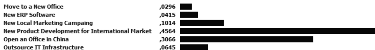
Рис. 4. Пример количественных поликритериальных мер соответствия сравниваемых альтернатив [4]

шем рейтинговые оценки альтернатив, на основе которых и производится их ранжирование, могут определяться и по нелинейным алгоритмам, неравнозначно оценивающим единичное приращение меры на различных уровнях соответствия.