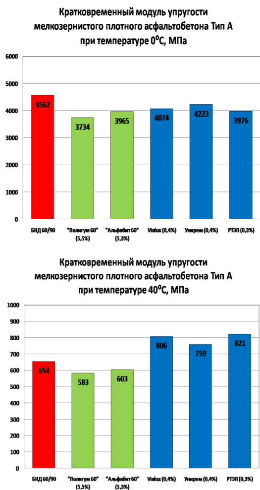
Рис. 3. Результаты испытания асфальтобетона из горячей мелкозернистой плотной смеси типа А на кратковременный модуль упругости при температурах 0 и 40 °С

На представленных диаграммах асфальтобетоны, приготовленные с применением различных добавок и ПБВ выделены цветом в зависимости от их функционального назначения: стабилизирующие – бежевым, модифицирующие – синим, полимерно-битумные вяжущие – зеленым и асфальтобетоны, приготовленные без добавок – красным (только для типа А). Проведенные исследования позволили выявить влияние модифицирующих и стабилизирующих добавок, а так же полимерно-битумных вяжущих (ПБВ) разных производителей на кратковременный модуль упругости асфальтобетона типа А и щебеночно-мастичного асфальтобетона.